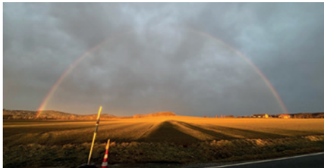
Regenbogen über Burkau am 20.01.2025