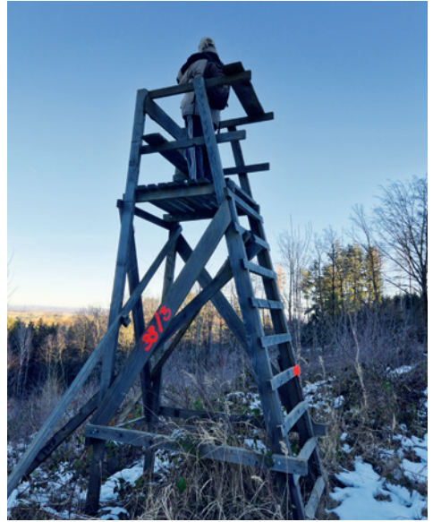
Rainer Rieger hat den besten Ausblick

Nach der Rast und den Eintragungen in das Gipfelbuch ging es Richtung Wildbrücke und an der Autobahn entlang zurück zum Pendlerparkplatz. Einige setzten die Wanderung bis zum Vereinshaus nach Burkau fort. Dort warteten schon Glühwein, Kekse und Getränke auf die durstigen Heimkehrer. Vielen Dank an die fleißigen Hände die dies alles vorbereitet hatten. Zusammenfassend kann man sagen, ein toller Erfolg mit sehr guter Beteiligung, interessanten Gesprächen unterwegs und netten Leuten. Kleine Episode noch am Rande: Um keinen zu überfordern wandte ich mich an eine Familie mit zwei Kindern wie lang wir die Strecke wählen können. Antwort des Papas: Alles, was unter 100 km ist, schaffen wir. Na, da braucht uns keine Bange um wanderfreudigen Nachwuchs zu werden.